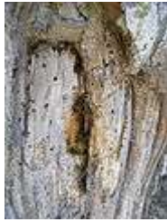
Abeilles dans un tronc d'arbre