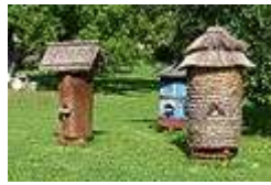
Ruches traditionnelles en Pologne