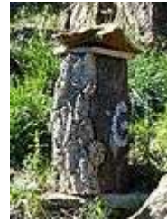
Ruche en liège, dans le Var