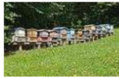
Ruches exploitées, Haute Savoie