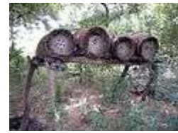
Ruches en Afrique, Burkina Faso

L'abeille mellifera, abeille à miel, est une bâtisseuse. Elle construit les parois de son habitat à partir de cire.